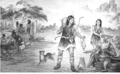
男性への富の集中が母権から父権へ

織り、田畑の耕作の発展によって物質的生産が高まりました。労働力の不足分は、戦争で捕えた敵を奴隷として賄う