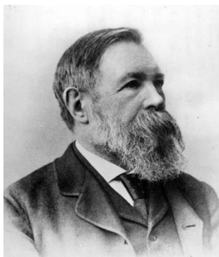
晩年のエンゲルス（1981年）