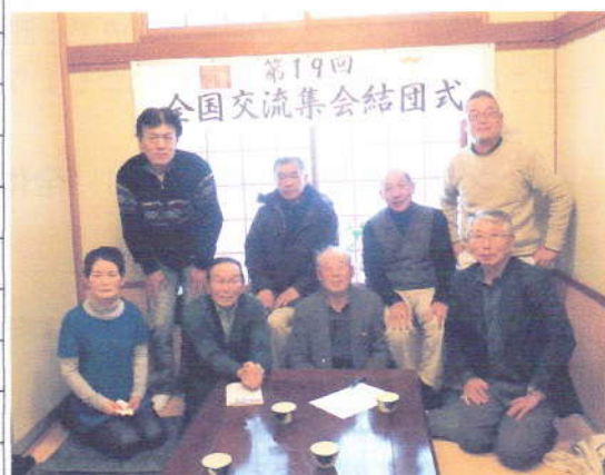
結団式に結集した役員