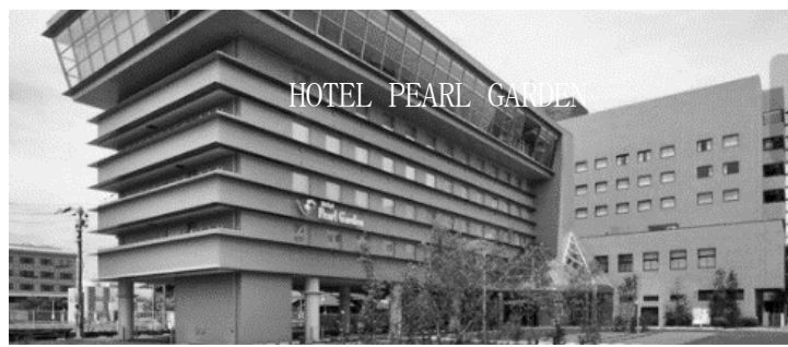
HOTEL PEARL GARDEN