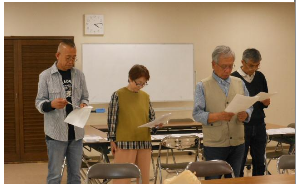
関東ブロック練習風景