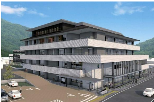
三好市新庁舎起工 25年1月利用開始を目指す (徳島新聞デジタル)

これまで労働組合の協力を得て政治の世界に入った現市長の裏切りともいえる労働組合締め出しの攻撃に対し、どう対応すればいいのか、会場の仲間とともに考えていきたい。