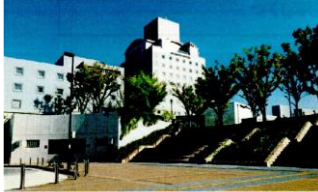
ホテル日航つくば つくば駅前ロータリーから