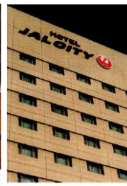
ホテルJALつくば 西 表玄関側から