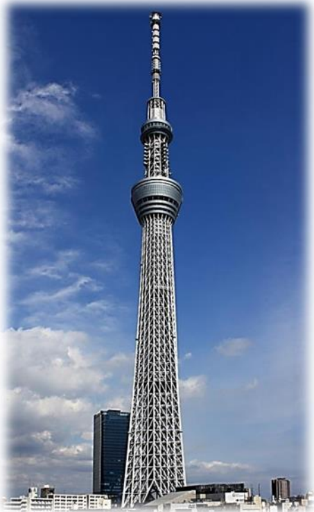
お江戸の名勝・東京スカイツリー (高さ:634メートル、世界一の塔)

総会で、後半の友の会運動を積み上げ、成果と課題を明らかにし、2017年5月20日～21日に開かれる第22回全国交流集会で中間総括をしましょう。多くの仲間の参加を「お江戸」でお待ちしています。