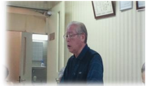
(南部光春現地実行委員会委員長)

総会で、後半の友の会運動を積み上げ、成果と課題を明らかにし、2017年5月20日～21日に開かれる第22回全国交流集会で中間総括をしましょう。多くの仲間の参加を「お江戸」でお待ちしています。